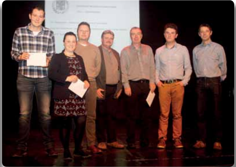
Kampioenviering en uitreiking sportprijzen