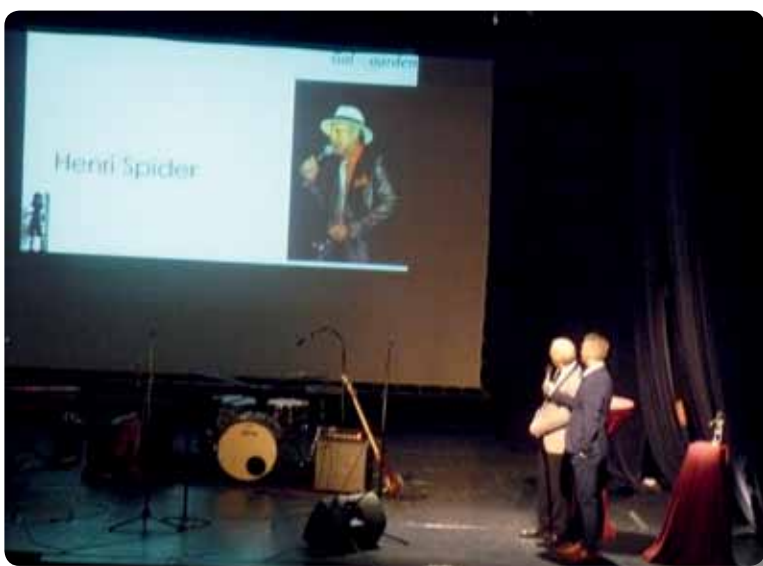
Uitreiking Bronzen Urbanus