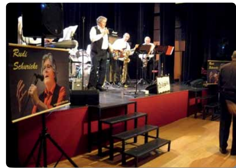
Kaffee Matinee met "De Kringband"